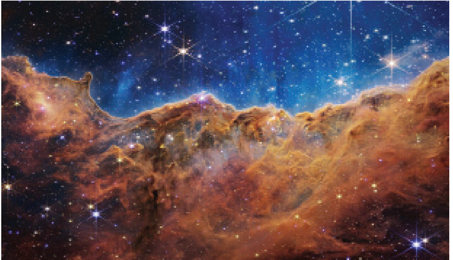
La regione di formazione stellare NGC3324 nella costellazione della Carena, qui osservata dalla camera infrarossa NIRCAM. Osservando nell'infrarosso, si possono vedere le migliaia di stelle giovanissime che nel visibile erano nascoste dalle nubi di polvere. L'età di queste stelle è 50.000-100.000 anni, e possiamo osservare le prime fasi della loro vita.